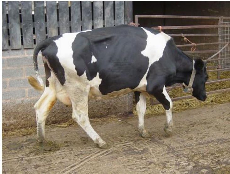
Slika 9. Hromost.

Površine staza nasteljene organskim materijalom, poput borovih strugotina ili slame, moraju se dosteljavati najmanje dva puta godišnje, kamene staze u područjima s velikom količinom padalina obnavljati svake dvije do četiri godine, dok tvrdi kamen stabiliziran cementom traje i dulje. Betonske staze često traju dugi niz godina (Green, 2012.).