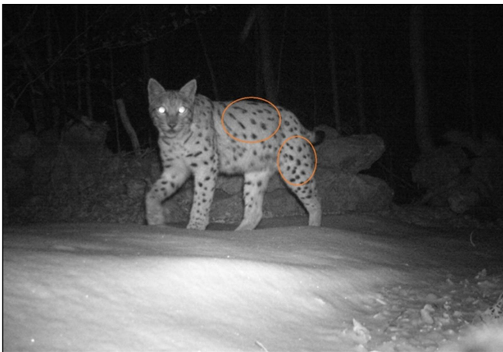
Slika 4. Fotoidentifikacija risa prema specifičnom pjegastom uzorku