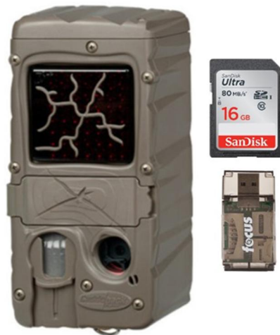
Slika 1. Fotozamka s memorijskom karticom i baterijom