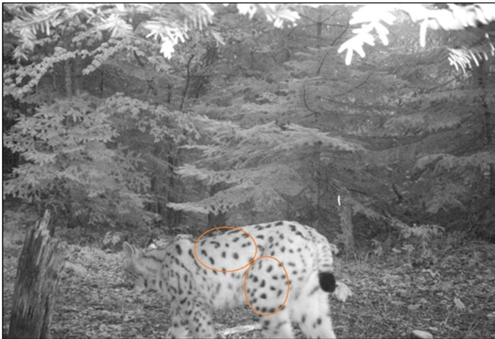
Slika 3. Fotoidentifikacija risa prema specifičnom pjegastom uzorku.

Fotoidentifikacija risa temelji se na usporedbi uzorka pjegaste pigmentacije krzna na fotografijama iste strane tijela. Identifikacija se izvodi postavljanjem dviju fotografija jednu uz drugu te traženjem podudaranja (Slika 3. i Slika 4.).